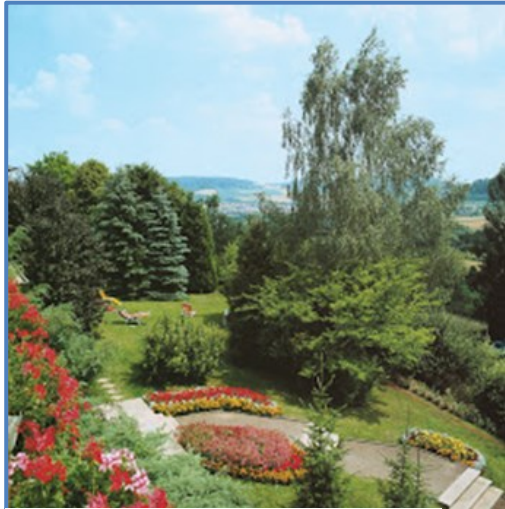
Bad Mergentheim - Kurpark