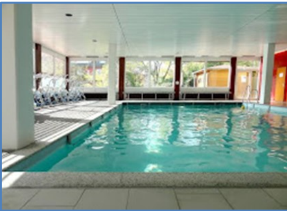
Vitalhotel König - Schwimmbecken