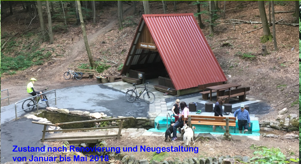
Zustand nach Renovierung und Neugestaltung von Januar bis Mai 2018