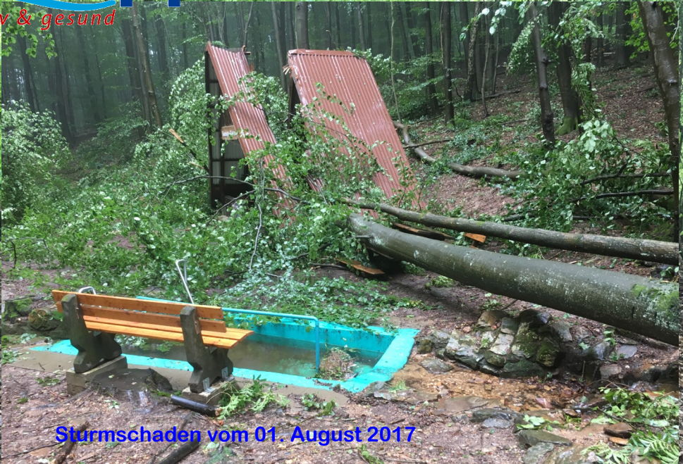
Sturmschaden vom 01. August 2017