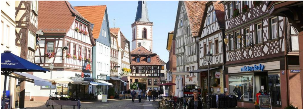
Lohr am Main, Altstadt